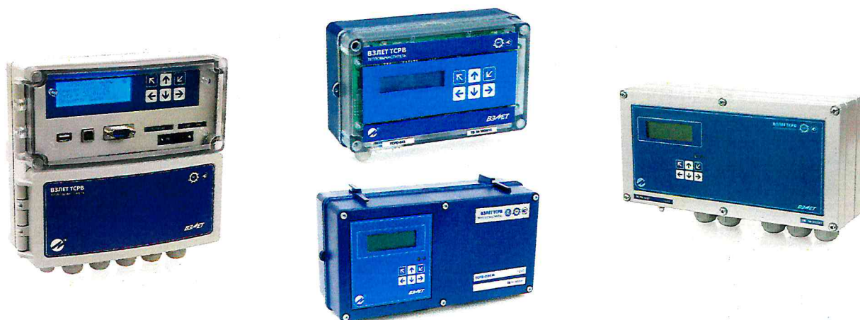
Рисунок 1 – Общий вид тепловычислителей ВЗЛЕТ ТСРВ

Пломбировка от несанкционированного доступа тепловычислителей ВЗЛЕТ ТСРВ осуществляется нанесением знака поверки давлением на пломбировочную мастику, расположенную в пластиковом колпачке (или пломбировочной чашке с металлической скобой), закрывающем контактную пару разрешения модификации калибровочных параметров на электронной плате тепловычислителя ВЗЛЕТ ТСРВ, а также нанесением знака поверки давлением на пломбировочную мастику расположенную на винте крепления защитного экрана электронной платы тепловычислителей ТСРВ (только для исполнений ТСРВ-024М, ТСРВ-024М+, ТСРВ-025, ТСРВ-027, ТСРВ-042). Места пломбировки тепловычислителей ВЗЛЕТ ТСРВ различных исполнений приведены на рисунке 2.